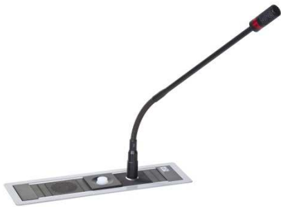
Anwendungsbeispiel Power Frame silver-grey

Keine Audio-Wiedergabe an Stelle des Kopfhöreranschlusses. Artikel-Nr.: 05.1211.32