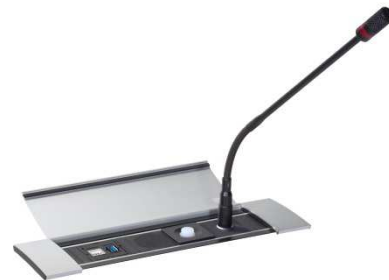
Anwendungsbeispiel Power Frame Cover Aluminium

Für das Custom-Chassis sind folgende Einsätze erhältlich: